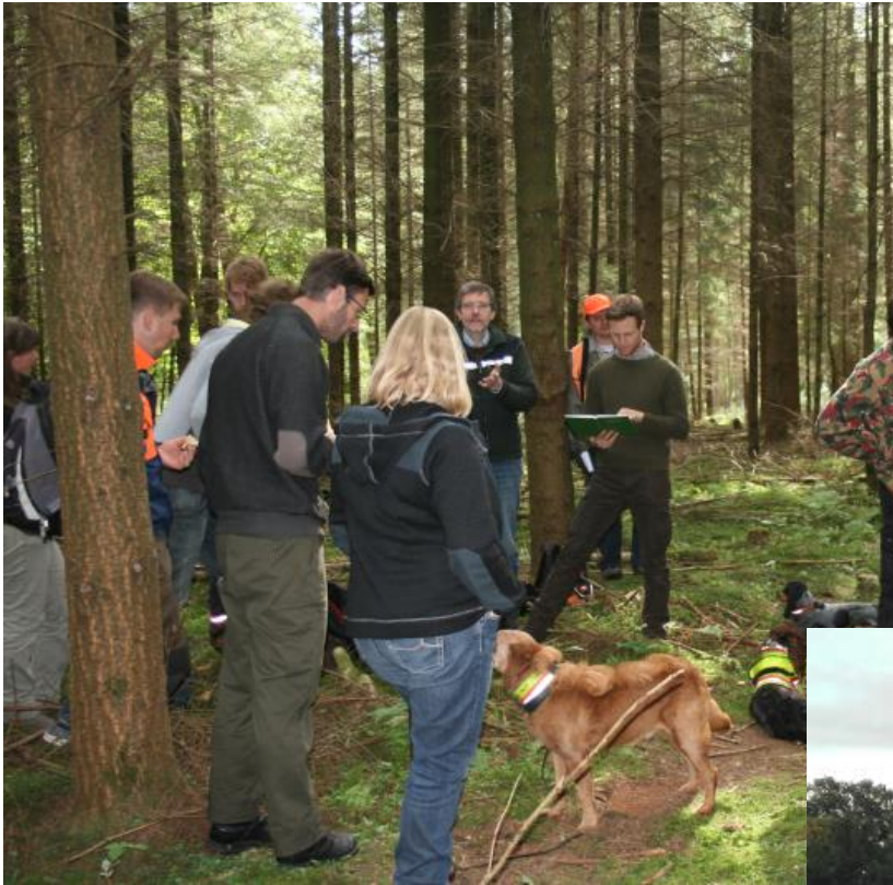
Summer School 2016