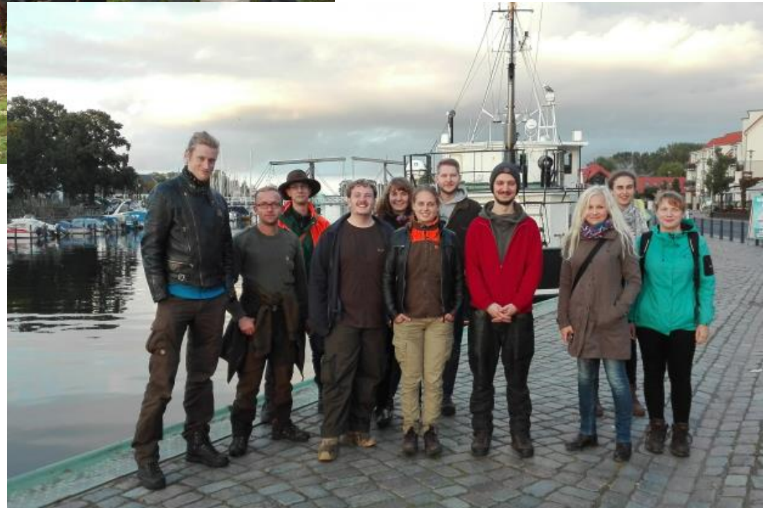
Summer School 2017